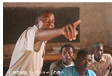
住民参加型ワークショップの様子