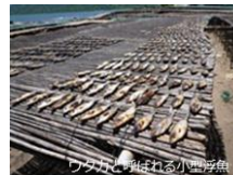
ワタカで干されるりい魚