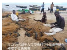
マロンベ湖チャボラ漁村で小規模な魚を処理する漁業者