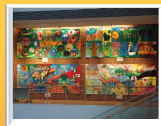
横浜とアフリカの子どもの共同制作壁画展